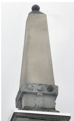
ул. Свободы, 161