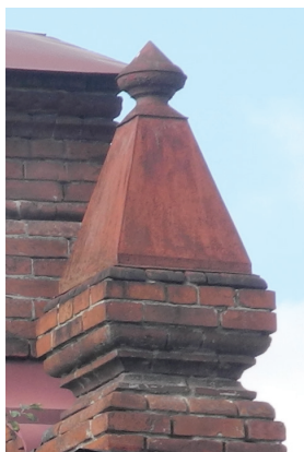
ул. Васенко, 25

Декоративный элемент в виде усеченной пирамиды.