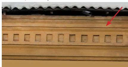
ул. Свободы, 165

Архитектурные элементы, различные по своему поперечному сечению — профилю, расположенные по горизонтали (на цоколях, в карнизах , междуэтажных поясах или тягах , базах колонн ), иногда по наклонной (в карнизах фронтонов ), кривой ( архивольты арок , нервюры ) или ломаной (обрамления порталов, окон ) линии.